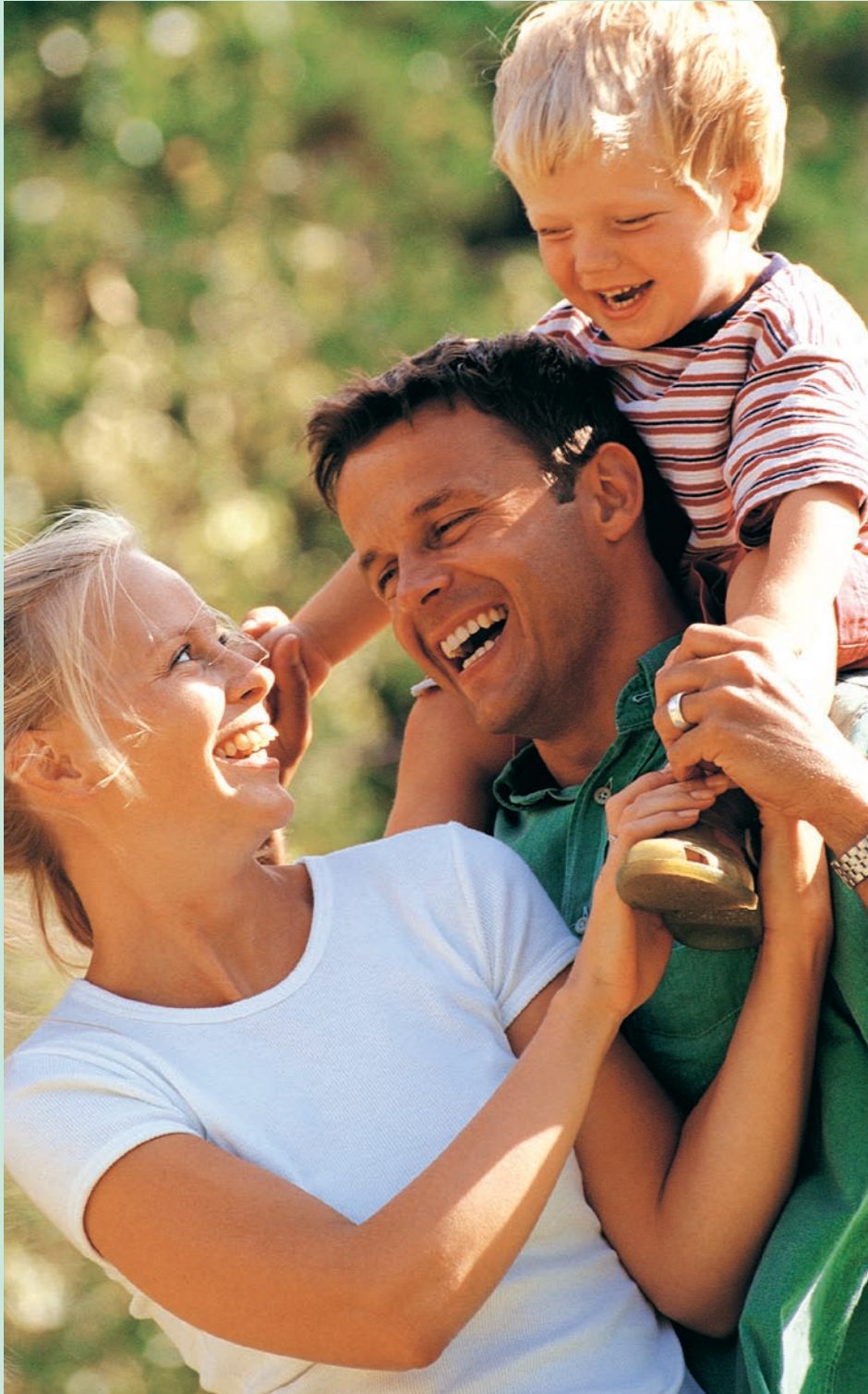
Mamis und auch Papis machen sich in der «ElternLehre» fit für die Erziehungsarbeit.

Der Verein Elternbildung Kanton Bern VEB startete letztes Jahr mit der sogenannten «ElternLehre». In diesem 18-monatigen Workshop können sich frischgebackene Eltern das Rüstzeug für ihren anspruchsvollen 24-Stunden-Job holen – Kompetenzausweis inklusive. Text: Silvia Stähli-Schönthaler.