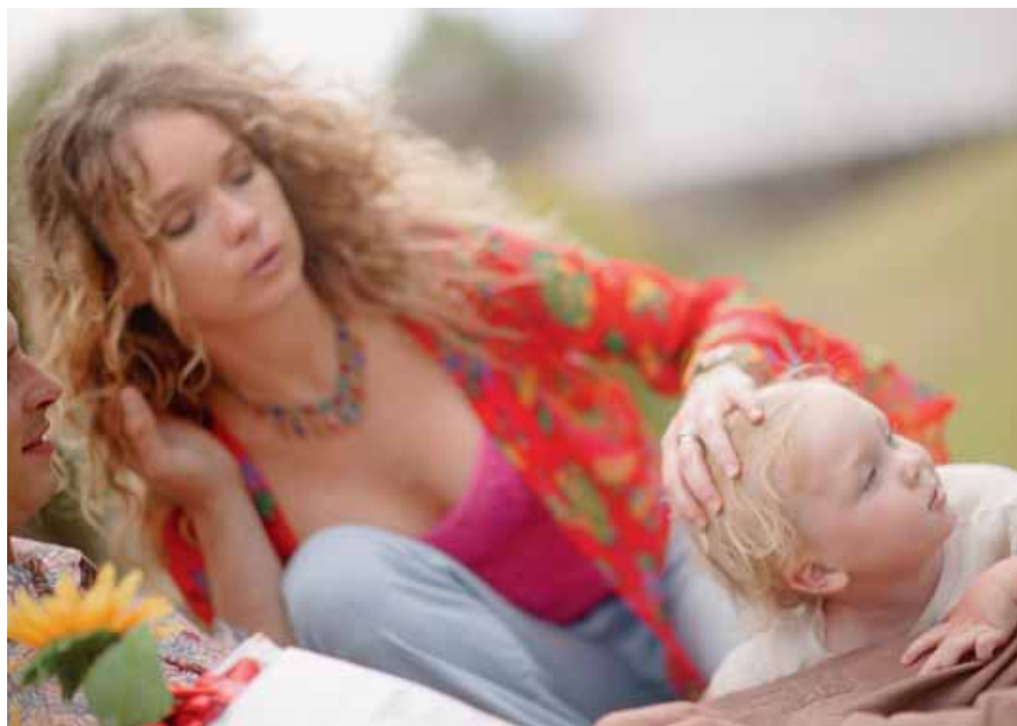
Projekt ElternLehre: Erziehen ist lernbar, dies glauben der Kanton Bern und der Verein Elternbildung.

INFO: Spannende Experimente. Ravensburger, ab 6 Jahren, Fr. 19.20, ISBN 978-3-473-55625-0