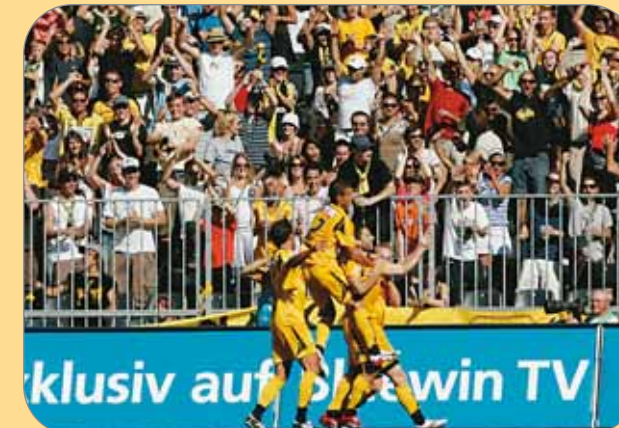
YB zieht das Publikum an – Tendenz steigend.

Das ist eine der Fragen, die wenige Monate vor dem EURO-08-Ankick unter den Berner Lauben diskutiert wird. Eine andere beschäftigt vor allem die Verantwortlichen auf der Geschäftsstelle von YB und STADE DE SUISSE: Steht «tout Berne» weiterhin zum BSC Young Boys und kann der Aufwärtstrend in Sachen Zuschaueraufmarsch sowie Mitgliederzahlen fortgesetzt werden? Die Aussichten jedenfalls sind vielversprechend – im Jahr des 110-jährigen Bestehens von YB ist ein zweifacher Rekord in Sicht: