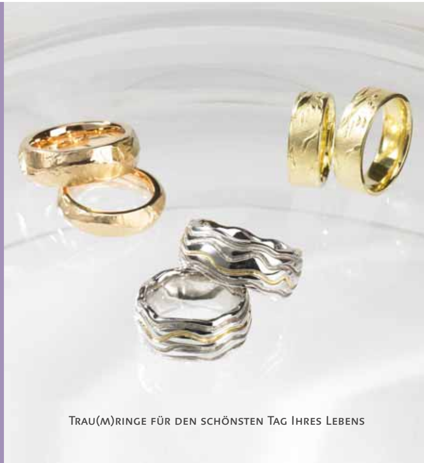
TRAU(M)RINGE FÜR DEN SCHÖNSTEN TAG IHRES LEBENS

Kramgasse 67 - 3011 Bern www.staehli-goldschmied.ch