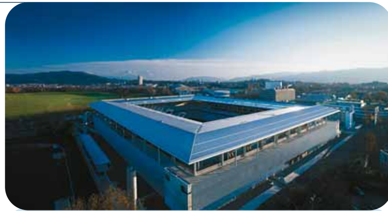
Stade des Suisse