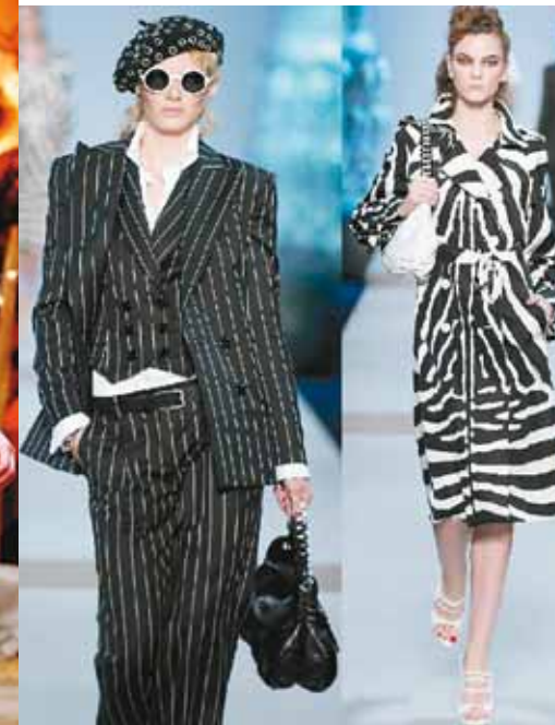
Transparenz, Blumen, leuchtende Farben, Streifen, grafische Muster und Ethno-Stil, dies die wichtigsten Trends der neuen Mode.